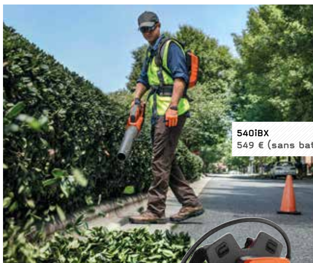
540iBX 549 € (sans batterie)

Type de moteur : brushless / Type de turbine : axiale Poids (sans batterie) : 2,5 kg / Débit d'air maximum avec booster : 76 m³/min / Vitesse de soufflerie avec booster : 63 m/s / Longueur du tube : 48,5 cm / Niveau sonore : 77 dB(A) / Réservoir de carburant : 0,7 l Réservoir d'huile : 0,35 l / Vitesse de chaîne : 20,7 m/s Pression acoustique à l'oreille de l'utilisateur : 105 dB(A)