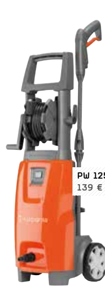
PW 125 139 €

Pression max : 150 bar / Débit max : 640 l/h Puissance : 2 900 W / Poids : 27,8 kg