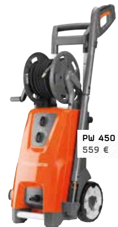
PW 450 559 €