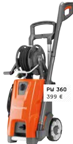
PW 360 399 €