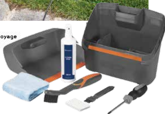
Kit de nettoyage 35 €