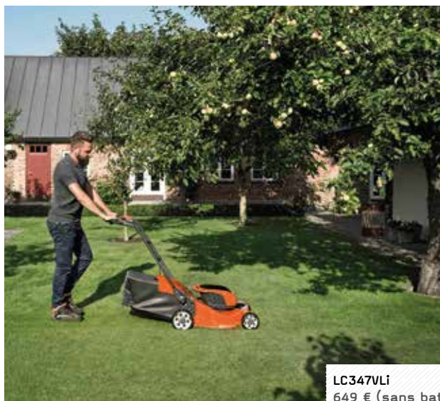
LC347VLI 649 € (sans batterie)

Type de moteur : brushless / Carter de coupe : composite Diamètre de coupe : 47 cm Poids (sans batterie) : 24 kg / Réglage des hauteurs de coupe : centralisé / Bac de ramassage : 55 litres