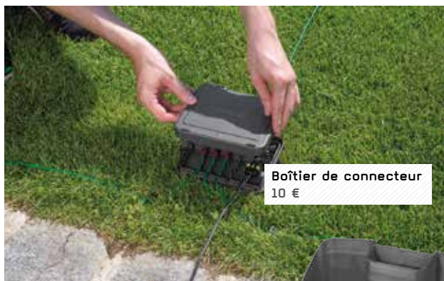
Boîtier de connecteur 10 €

Ce boîtier permet de protéger les connecteurs des intempéries durant la période hivernale.