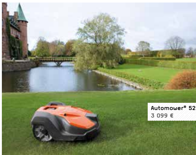
Automower® 520 3 099 €