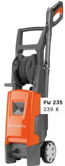
PW 235 R 239 €