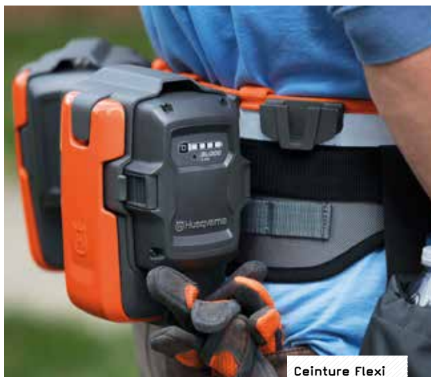
Ceinture Flexi à partir de 99 €

Robustes, les étuis porte batterie peuvent être orientés en fonction des besoins pour une insertion de la batterie par le côté droit ou gauche. Une fonction verrouillage en 2 étapes a été pensée pour éviter de perdre la batterie et protéger celle-ci de la pluie et de la poussière. Un étui avec connecteur permet de brancher différents appareils tels que l'adaptateur pour la batterie à dos par exemple. Quant à l'étui avec adaptateur, il permet de connecter tous les produits équipés d'une batterie interne et de travailler avec un produit plus léger dans les mains pour 100 % d'ergonomie. Réglable, la ceinture Flexi est légère. Sa matière respirante évacue rapidement la transpiration ou l'eau en cas de pluie pour un confort de travail garanti.