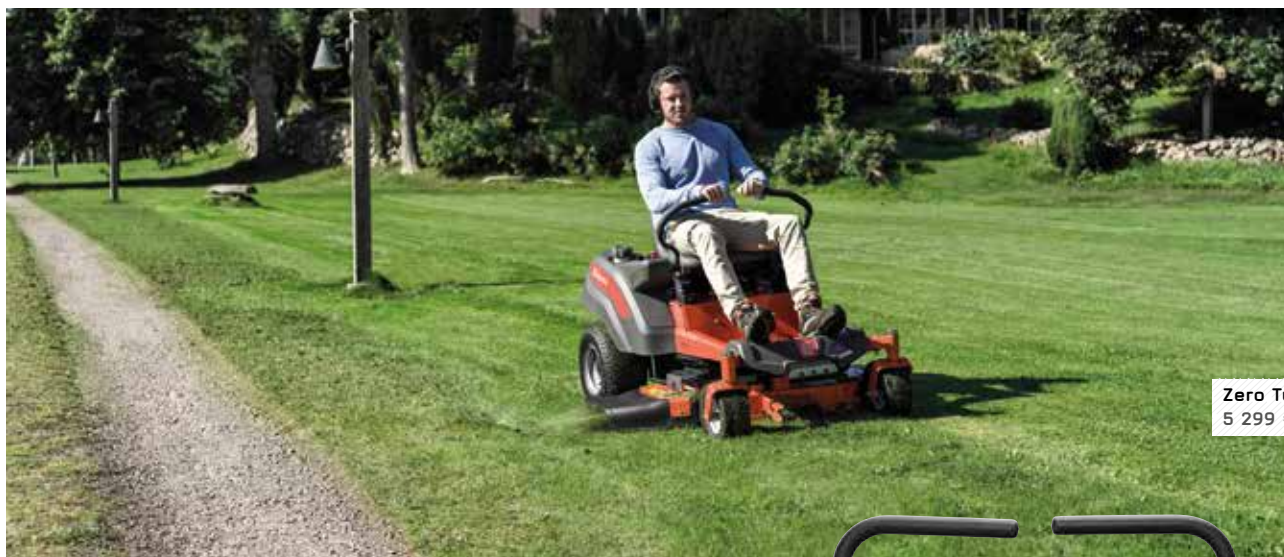
Zero Turn 5 299 €

Husqvarna lance en 2018 une toute nouvelle gamme de tondeuses autoportées à la fois robustes et efficaces : Zero Turn. Leur particularité ? un rayon de braquage zéro qui offre rapidité de tonte, manœuvrabilité et compacité.