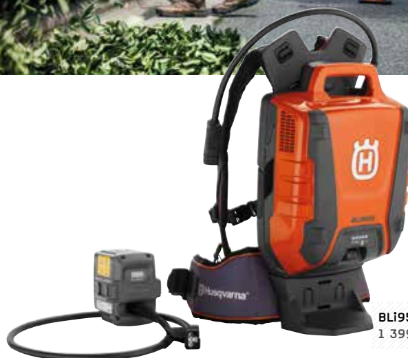
BLi950X 1 399 €

Technologie : Li-Ion / Voltage : 36 V / Capacité : 31,1 Ah Energie : 1 120 Wh / Poids (sans harnais) : 7,8 kg