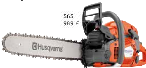
565 989 €