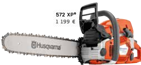
572 XP® 1 199 €

Cylindre : 70,7 cm³ / Puissance : 3,7 Kw Poids à vide : 6,5 kg / Pas de chaîne - Jauge : 3/8 - 1,5 Longueur du guide : 45/50 cm Réservoir de carburant : 0,7 l / Réservoir d'huile : 0,35 l Vitesse de chaîne : 20,7 m/s / Pression acoustique à l'oreille de l'utilisateur : 105 dB(A)