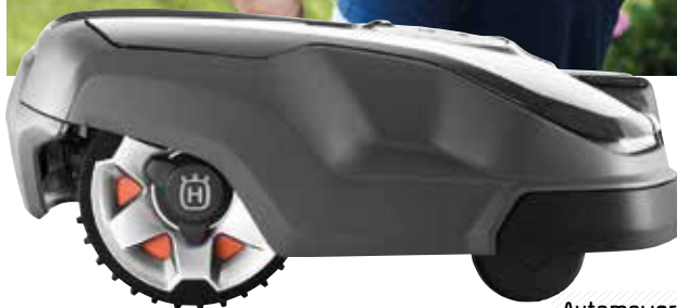
Automower® 315 2 399 €