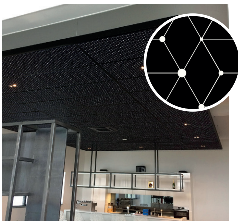
Cubes Noir | C1