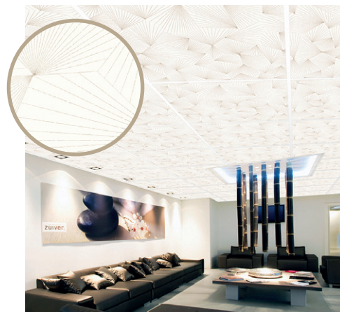
Ombelle Dune | O2