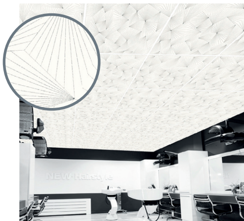
Ombelle Ardoise | O1

Plus exotique, ce décor japonisant et poétique évoque le voyage et l'apaisement grâce à des motifs ombellifères sur fonds clairs. Il soulignera parfaitement une atmosphère détendue en hôtellerie ou dans des lieux à la décoration soignée.