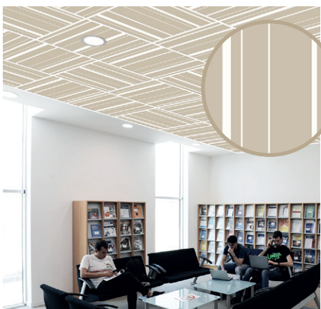
Bayadère Calcaire | B2

Simplicité et géométrie sont les maîtres mots de ce décor aux lignes épurées. Leur rythme trouvera sa place dans des bureaux ou des salles de réunions.