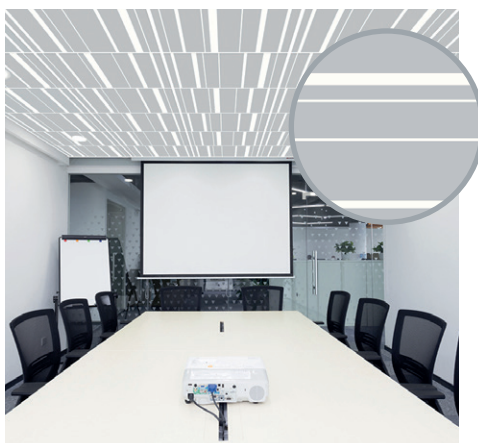
Bayadère Aluminium | B1