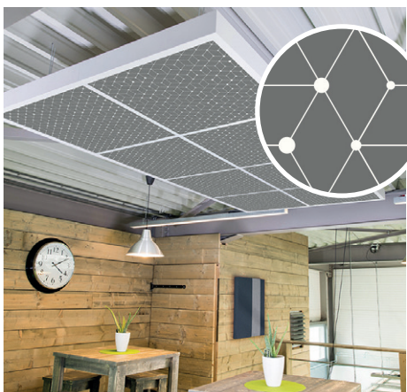
Cubes Zinc | C2

Ce décor géométrique répétitif évoque l'infini du ciel par son association de ponctuation claire sur fonds foncés. Ce motif est idéal pour les lieux de spectacles ou nocturnes, mais aussi pour marquer un espace dans le secteur tertiaire.