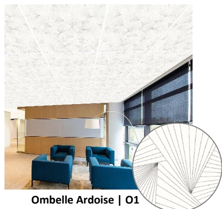
Ombelle Ardoise | O1