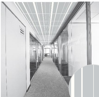
Bayadère Aluminium | B1