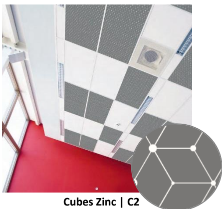
Cubes Zinc | C2