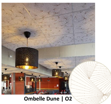
Ombelle Dune | O2

Des motifs ombellifères sur un fond clair qui rappellent le voyage et l'apaisement. Des traits japonisants et poétiques qui apportent une atmosphère détendue aux espaces hôteliers.