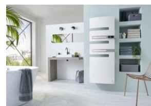
Atlantic - Stand 2E73

Avec Serenis Premium est un sèche-serviettes au style inattendu, avec une façade lisse et galbée, disponible en 9 couleurs, et deux barres de portage, dont une repositionnable sur le cadre. Il offre, grâce à sa fonction Boost, une sensation rapide de chaleur et grâce à ses enceintes Cabasse intégrées, des plaisirs inégalés avec un son haute définition. Grâce à l'application Atlantic Cozytouch, Serenis Premium est pilotable et programmable à distance. Disponible en 9 couleurs, en 1 750 Watts.