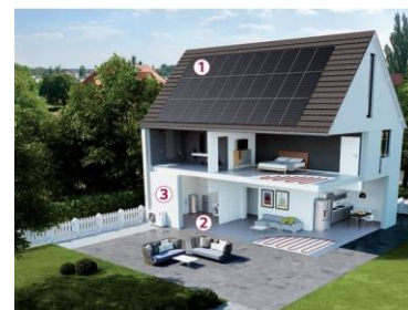
LG Electronics France - Stand 2F50

LG Electronics est le 1 er et seul constructeur à proposer le « Pack Energie Résidentielle », le premier pack énergétique au monde comprenant toutes les solutions nécessaires à la production, au stockage et à l'utilisation d'énergie solaire. En combinant trois produits LG, les panneaux photovoltaïques, le système de stockage d'énergie et la pompe à chaleur air-eau, les particuliers peuvent générer leur propre énergie renouvelable. Il est alors possible de la stocker pour l'utiliser ultérieurement, de la revendre sur le réseau public ou bien de l'utiliser pour le chauffage et l'eau chaude sanitaire. Les panneaux photovoltaïques captent l'énergie solaire et la transforment en courant continu. Pour être utilisé, stocké ou revendu, ce courant continu est transformé en courant alternatif par un onduleur.