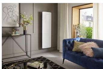
Atlantic - Stand 2E73

Produits connectés et design, énergies renouvelables, intelligence artificielle, autoconsommation... INTERCLIMA 2019 (du 5 au 8 novembre 2019 à Paris-Nord Villepinte), rendez-vous incontournable des acteurs du génie climatique, fait le plein d'innovations pour apporter confort, économies d'énergie et bien-être aux particuliers, tout en respectant l'environnement.