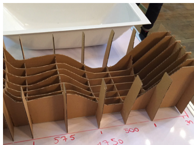
DE NOMBREUSES MAQUETTES ONT PERMIS D'ÉPROUVER CHACUN DES POINTS DE CONFORT ET D'ERGONOMIE.

Caractérisée par son style épuré et contemporain, Aisance s'inscrit dans la modernité, avec une nature toute particulière au regard de ses lignes adoucies.