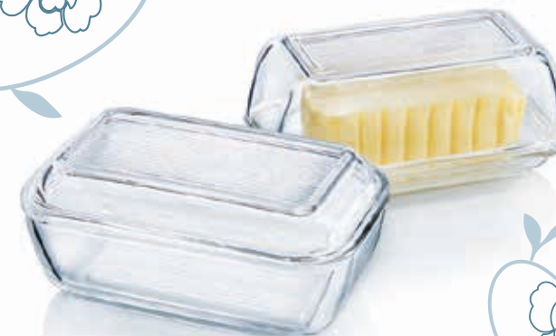
Boîte à beurre doux ou demi-sel...

🍷 L 17 cm x l 10,5 cm x h 6,2 cm : 5,40 €