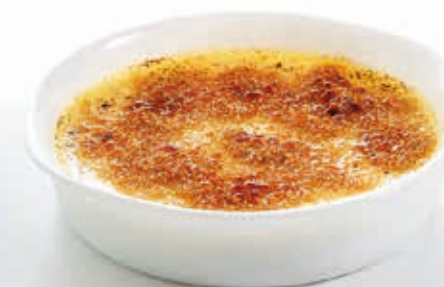
Ramequin crème brûlée Smart Cuisine

Le verre opale culinaire résiste à la cuisson au four à 250 C°