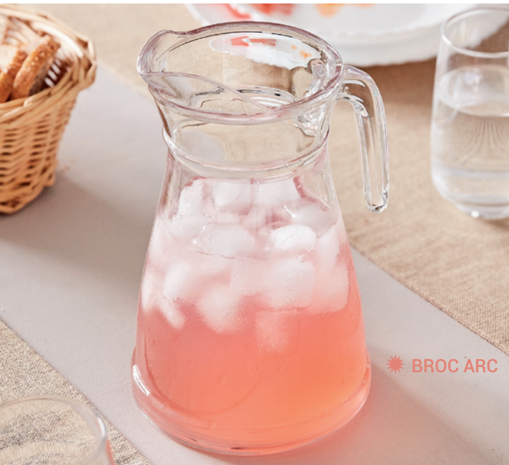
☀ BROC ARC

Quelque part dans la Vallée des Roses, pour siroter lentement des saveurs sucrées !