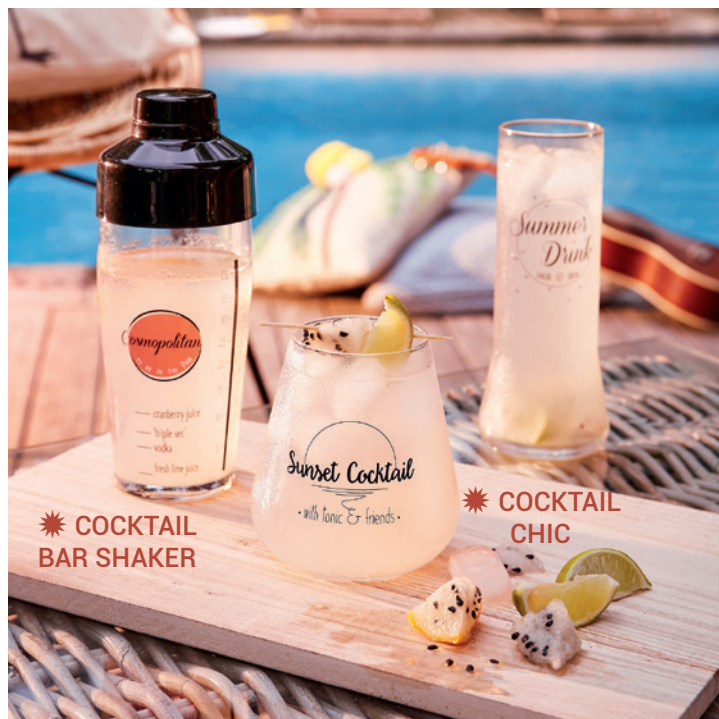
☀ COCKTAIL BAR SHAKER