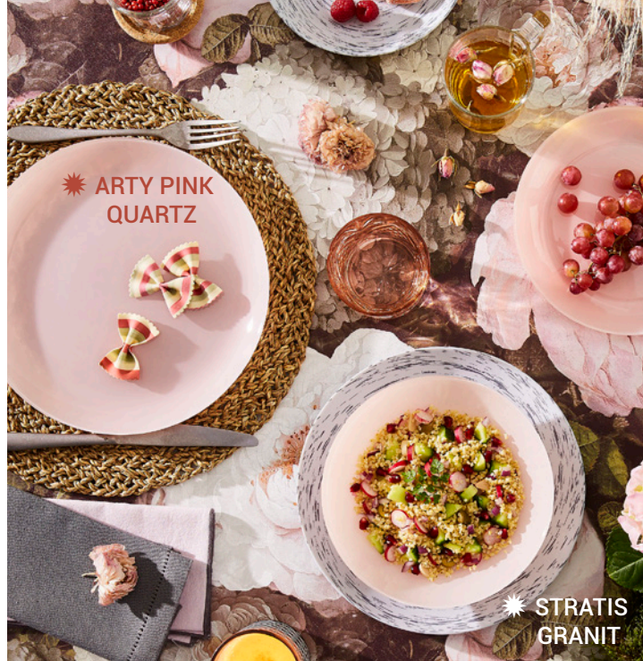
☀ ARTY PINK QUARTZ

Gobelet bas 35 cl : 3,20 € Gobelet haut 47 cl : 3,40 €