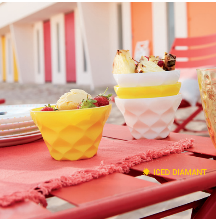
☀ ICED DIAMANT

Le soleil se montre sous un jour nouveau et le pouvoir des fruits change la donne.