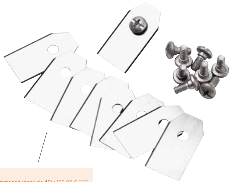
LAMES HHS PRO Prix indicatif recommandé (pack de 45) : 169,99 € TTC