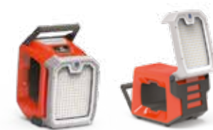
FLOODLIGHT 8K Disponibilité : avril 2022 Prix indicatif recommandé : 299 € TTC

Le guide X-Precision ¼ mini est doté d'une précision supérieure et de coupes plus nettes, le guide présente un faible poids ce qui facilite la montée dans l'arbre et également une réduction du bruit lors de la coupe. Ce guide est parfaitement adapté pour une utilisation avec la nouvelle chaîne SP11G.