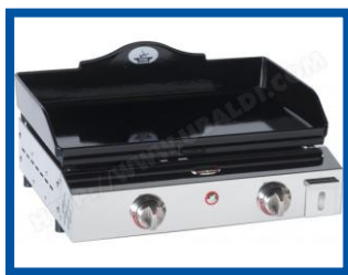
Plancha Prestige 600 de Forge Adour

Avec un châssis tout inox, elle est équipée d'une plaque haute qualité réglable, de brûleurs puissants garantissant une bonne montée en température ainsi que d'un bac récupérateur de graisse.