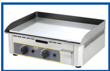
Plancha PSR 600 GC de Roller Grill

Equipée d'une plaque de cuisson en acier avec revêtement chromé, de 2 brûleurs 6 branches en étoile, elle offre une rapide montée en température et une cuisson homogène.